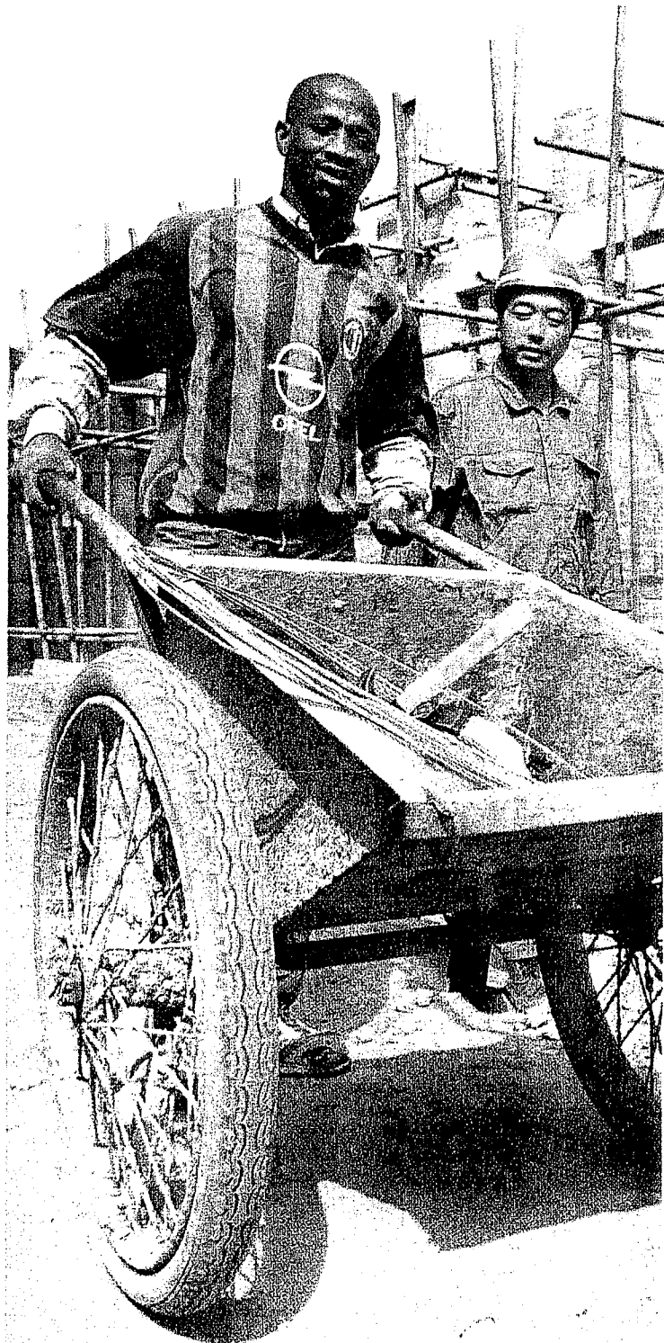
Hemd von Opel, Arbeiter aus Guinea-Bissau und China.

Die Alternative, die Khanna aufmacht, lautet: geopolitische Blöcke oder weitere Globalisierung. Unter Globalisierung versteht er die voranschreitende wirtschaftliche Verflechtung zwischen den USA, der Europäischen Union und China, die dazu führen werde, dass man mehr an Kooperation als an Konfrontation interessiert sei. Dem steht eine geopolitische Hemisphärenbildung gegenüber, bei der die USA den amerikanischen Kontinent kontrollieren und wirtschaftsprotektionistisch absichern, die Europäer dasselbe tun mit Europa sowie Teilen Afrikas und dem vorderen Orient, während sich die Chinesen auf Ostasien konzentrieren. Das könnte durchaus in eine friedliche Koexistenz münden, wenn es nicht jene Zwischenräume gäbe, über deren wirtschaftliche und politische Zugehörigkeiten zu einer imperialen Zone sich immer wieder Auseinandersetzungen entwickeln. Diese zweite Welt, wie Khanna die wichtigeren der in diesen Zwischenräumen beheimateten Staaten nennt,