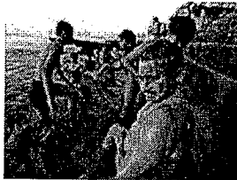
Der Ganges in Indien - Parag Khanna ordnet das Land der "Zweiten Welt" zu.